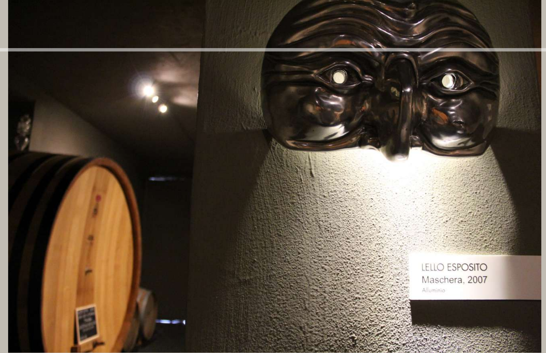
LELLO ESPOSITO Maschera, 2007 Alluminio