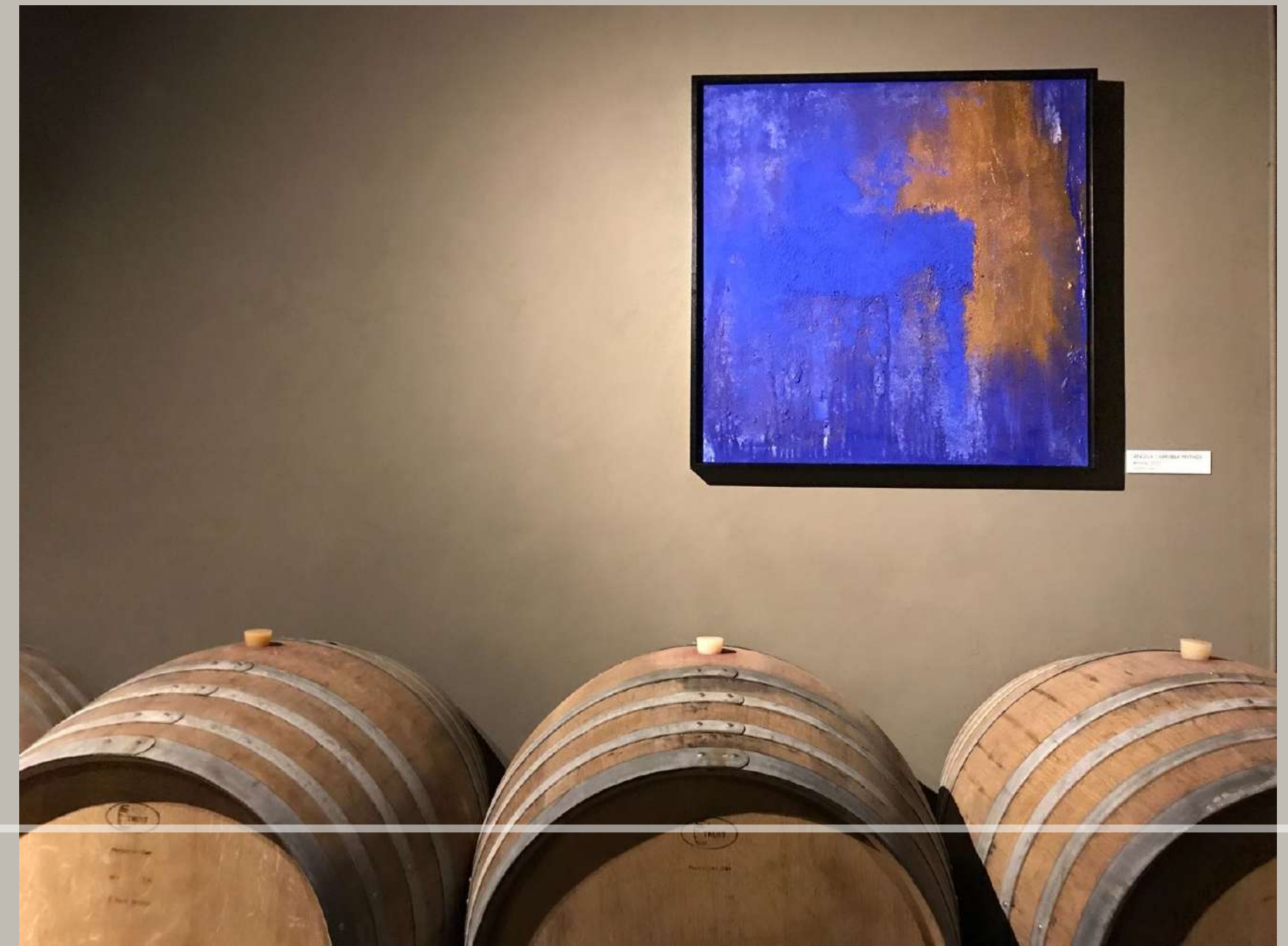
LELLO ESPOSITO Maschera, 2007 Alluminio