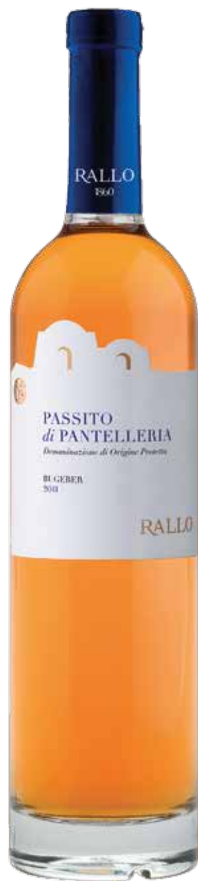
PASSITO DI PANTELLERIA Pantelleria DOP Bugeber - Pantelleria