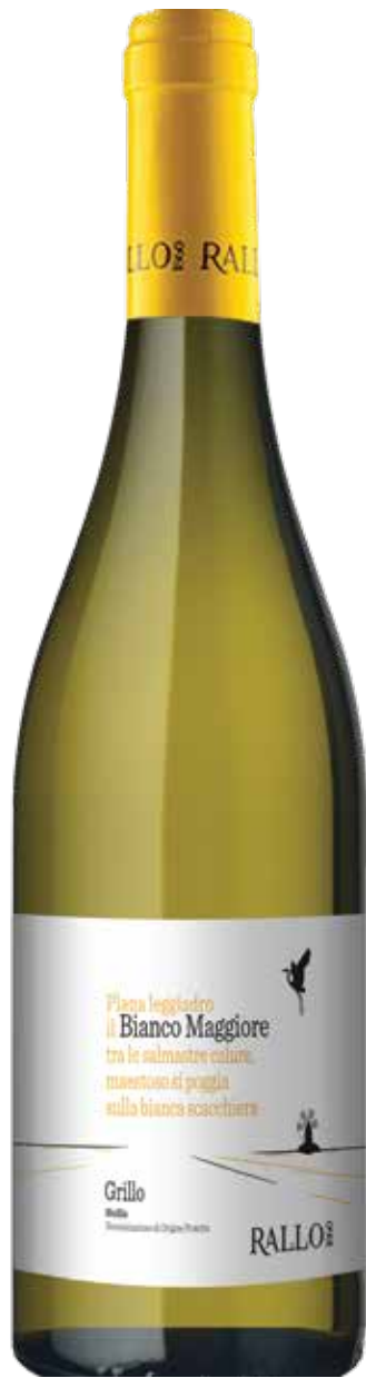
BIANCO MAGGIORE Grillo Bio Sicilia DOP / Piane Liquide - Marsala