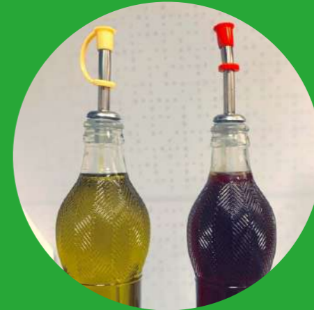
Porta Olio e Aceto