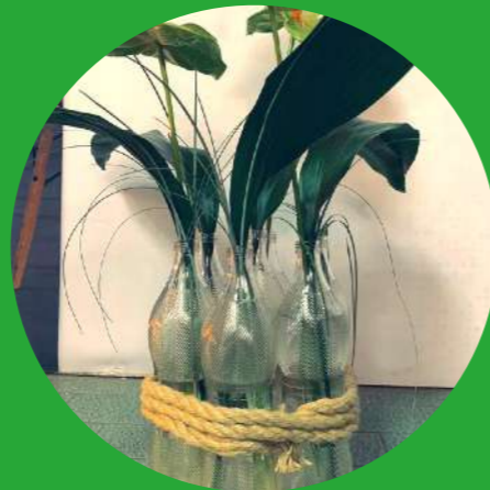
Vaso per piante