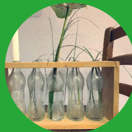
Vaso per piante