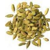
BACCELLI DI CARDAMOMO