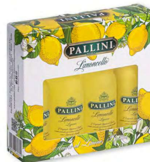
Mini Pack - 4x5 cl CF/CRT 12