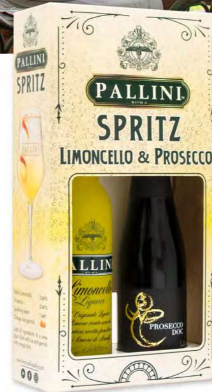
Spritz Pack 20+20 cl CF/CRT 6