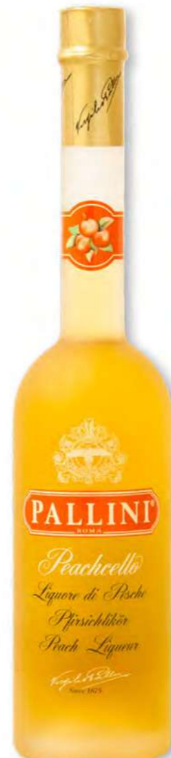
Peachcello 50 cl BTG/CRT 6