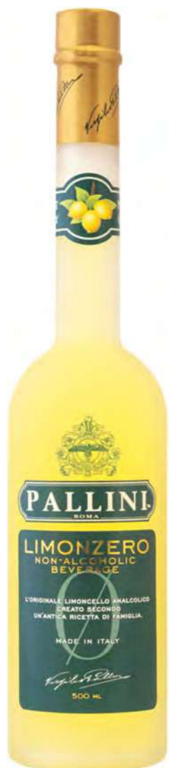
Limonzero 50 cl BTG/CRT 6 VOL 0%

Il Limoncello Pallini esalta il suo packaging con un'innumerabile quantità di formati e varianti. Il binomio tra l'elevatissima qualità del contenuto e il packaging ricercato ne fanno il marchio numero 1 al mondo nel segmento Super Premium. Il nostro limoncello è prodotto secondo un'antica ricetta custodita per anni dalla famiglia Pallini, con l'uso dei limoni "Sfusato IGP" provenienti dalle terrazze della Costiera Amalfitana.