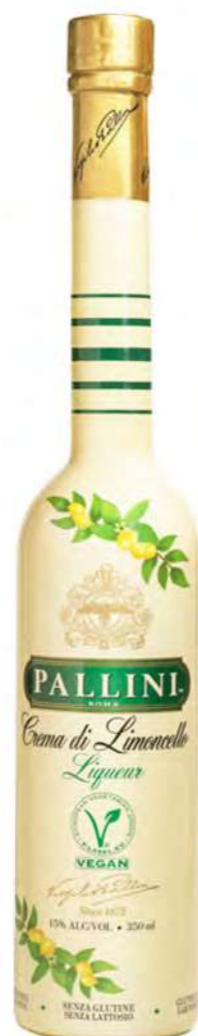
Crema di Limoncello 35 cl BTG/CRT 6