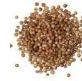
SEMI DI CORIANDOLO