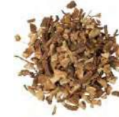
RADICE DI ANGELICA