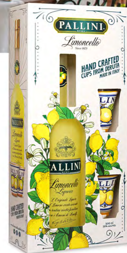
Deruta Pack 50 cl - 2 tazzine CF/CRT 6