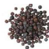
BACCHE DI GINEPRO

Nella nuova campagna " L'Arte della Perfezione " che accompagna il lancio della nuova bottiglia, il gin viene messo al microscopio restituendo delle immagini artistiche, il No.3 come opera d'arte.