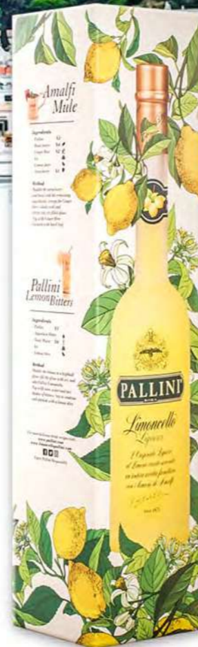
Astuccio 50 cl CF/CRT 6