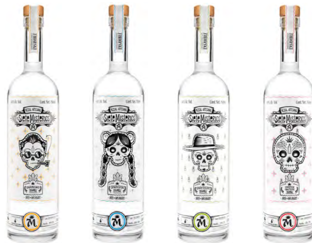
DOBA YEJ MEXICANITO 44%