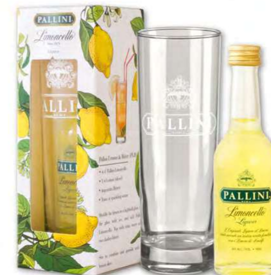
Cortina Gift 5 cl CF/CRT 24