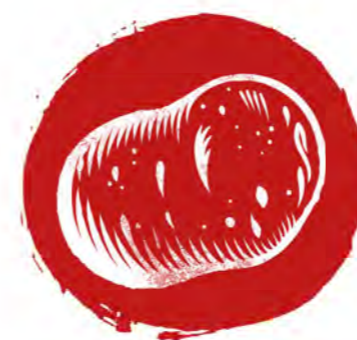
POTATOES FROM POLAND