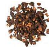
BUCCIA DI POMPELMO