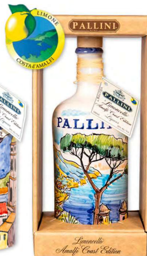
Amalfi Coast Edition IGP 50 cl VOL 28%