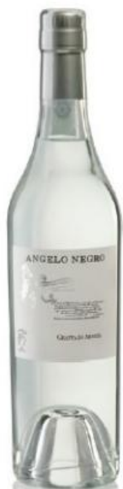
GRAPPA DI ARNEIS