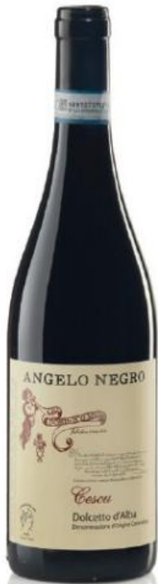
DOLCETTO D'ALBA DOC CESCU