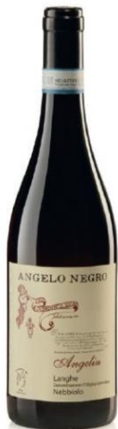
LANGHE DOC NEBBIOLO ANGELIN