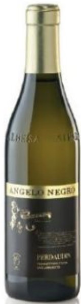
VINO OTTENUTO DA UVE APPASSITE PERDAUDIN