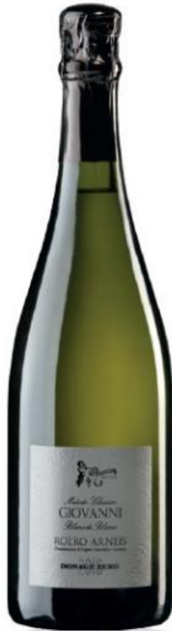
GIOVANNI ROERO ARNEIS DOCG METODO CLASSICO DOSAGE ZÉRO - BLANC DE BLANCS