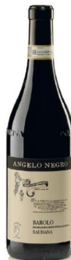
BAROLO DOCG BAUDANA 38 mesi tra botte e bottiglia 38 months between barrel and bottle