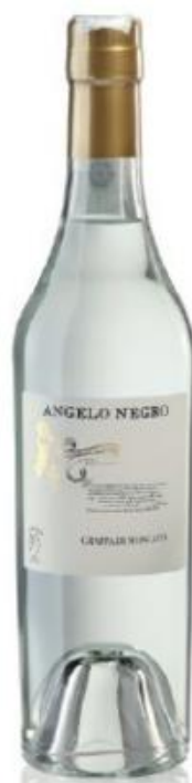
GRAPPA DI MOSCATO