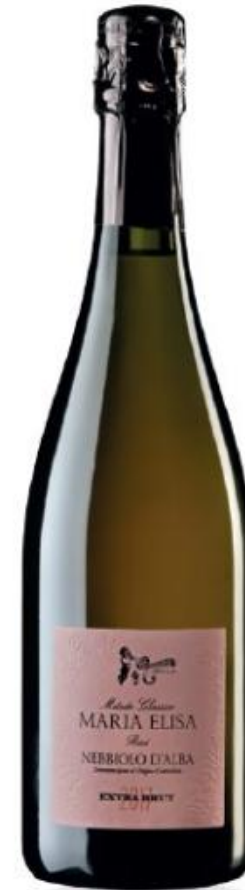
MARIA ELISA NEBBIOLO D'ALBA DOC ROSÉ METODO CLASSICO EXTRA BRUT