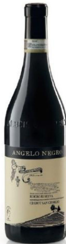
ROERO DOCG RISERVA CIABOT SAN GIORGIO 32 mesi tra botte e bottiglia 32 months between barrel and bottle