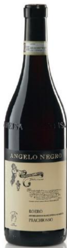
ROERO DOCG PRACHIOSO 20 mesi tra botte e bottiglia 20 months between barrel and bottle