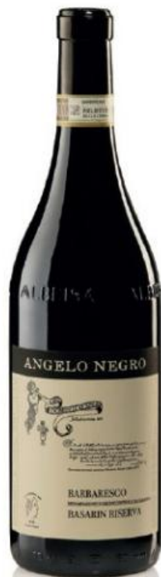
BARBARESCO RISERVA DOCG BASARIN 50 mesi tra botte e bottiglia 50 months between barrel and bottle