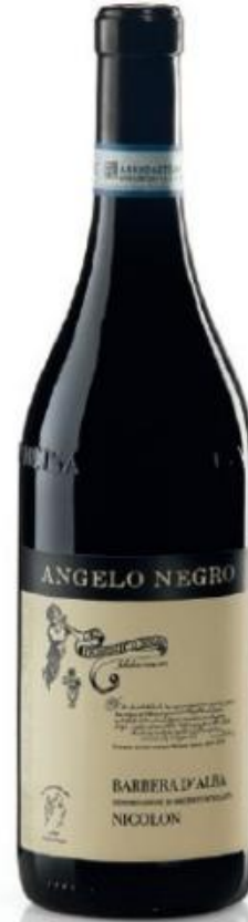
BARBERA D'ALBA DOC NICOLON