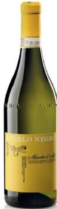
MOSCATO D'ASTI DOCG