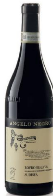
ROERO DOCG RISERVA SUDISFA 32 mesi tra botte e bottiglia 32 months between barrel and bottle