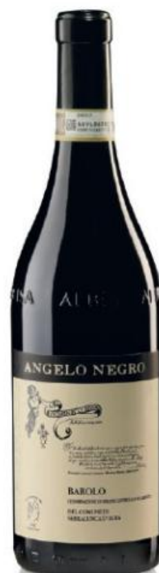
BAROLO DOCG DEL COMUNE DI SERRALUNGA D'ALBA 38 mesi tra botte e bottiglia 38 months between barrel and bottle