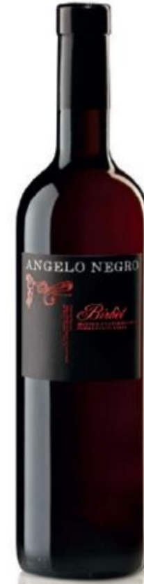
MOSTO PARZIALMENTE FERMENTATO BIRBÈT