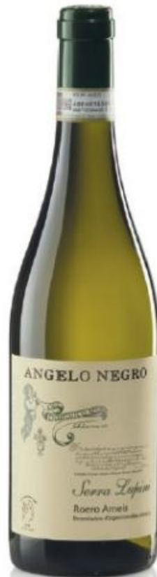
ROERO ARNEIS DOCG SERRA LUPINI