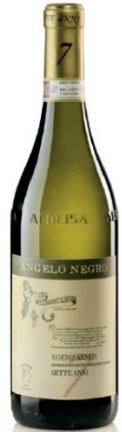
ROERO ARNEIS DOCG SETTE ANNI