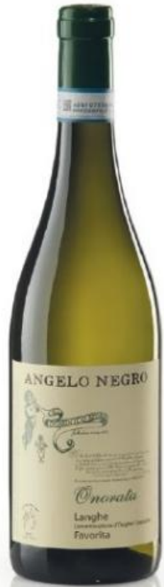
LANGHE DOC FAVORITA ONORATA