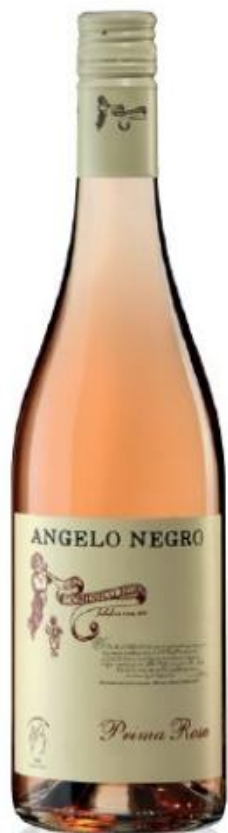
VINO ROSATO PRIMA ROSA