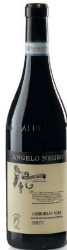
BARBERA D'ALBA DOC BERTU