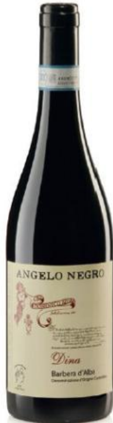
BARBERA D'ALBA DOC DINA