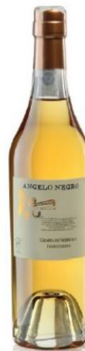
GRAPPA DI NEBBIOLO