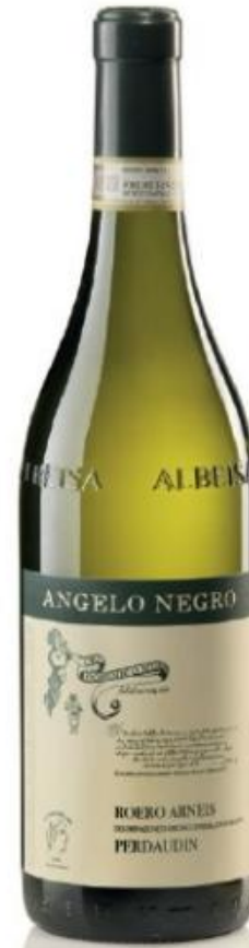
ROERO ARNEIS DOCG PERDAUDIN