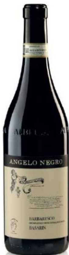
BARBARESCO DOCG BASARIN 26 mesi tra botte e bottiglia 26 months between barrel and bottle