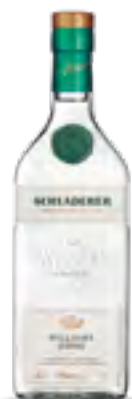
ACQUAVITE DI PERE WILLIAMS 70 cl - 42% vol.