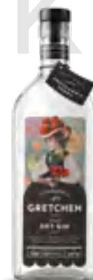
GRETCHEN DRY GIN 70 cl - 44% vol.