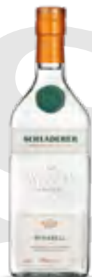
ACQUAVITE DI PRUGNE MIRABELLE 70 cl - 42% vol.