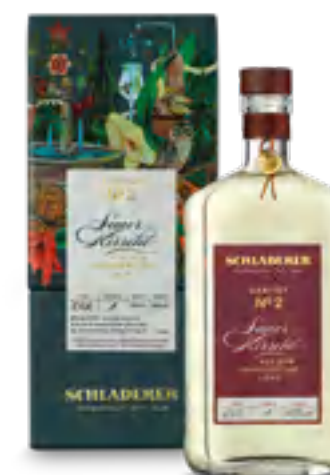
RARITY N° 2 AMARENA 50 cl - 43% vol.