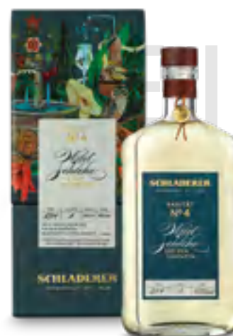
RARITY N° 4 PRUGNOLO SELVATICO 50 cl - 43% vol.