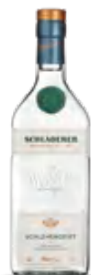
ACQUAVITE DI CILIEGIE 70 cl - 42% vol.