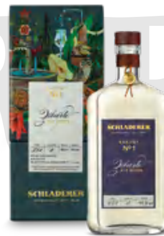
RARITY N° 3 PERA ROSSA WILLIAMS 50 cl - 43% vol.