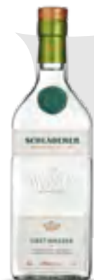
ACQUAVITE DI MELE E PERE 70 cl - 38% vol.