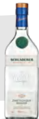
ACQUAVITE DI PRUGNA 70 cl - 42% vol.