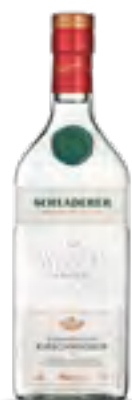
ACQUAVITE DI CILIEGIE 70 cl - 42% vol.