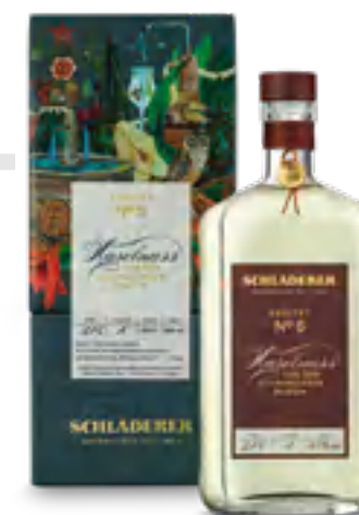
RARITY N° 5 NOCCIOLA 50 cl - 43% vol.