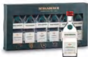
SET CLASSICO IN MINITURA 6 x 3 cl