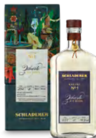
RARITY N° 1 PRUGNA SELVATICA 50 cl - 43% vol.